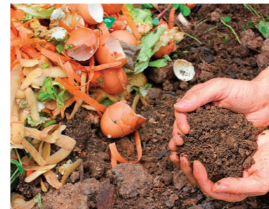
LE COMPOSTAGE, UN ATOUT DANS SON JARDIN!

Depuis le 1 er janvier 2024, tous les ménages doivent pouvoir trier leurs déchets biodégradables et les séparer du verre, des emballages ou du reste de la poubelle à ordures ménagères (Article L541-21-1 du code de l'environnement). Composter ses biodéchets représente aujourd'hui la solution incontournable pour agir sur son pouvoir d'achat en réduisant son volume de déchets et donc sa taxe; ainsi que sur l'environnement puisque le compost obtenu permet d'enrichir son jardin ou ses plantations naturellement.