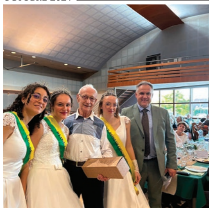
UNE AMBIANCE TOUJOURS CHALEUREUSE À L'OCCASION DU BANQUET DES AÎNÉS, LE TRADITIONNEL REPAS OFFERT AUX PLUS DE 70 ANS.