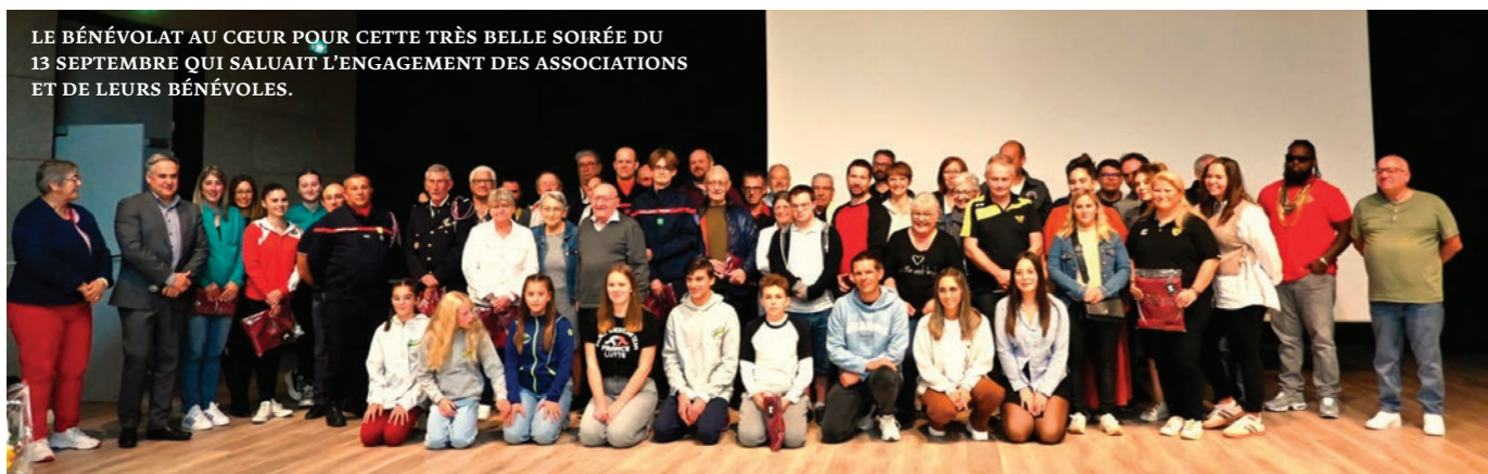
LE BÉNÉVOLAT AU CŒUR POUR CETTE TRÈS BELLE SOIRÉE DU 13 SEPTEMBRE QUI SALUAIT L'ENGAGEMENT DES ASSOCIATIONS ET DE LEURS BÉNÉVOLES.

Service Vie associative Tél. 03 85 47 80 00 vieassociative@ville-chagny71.fr