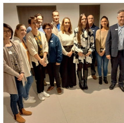
LE POT D'ACCUEIL POUR SOUHAITER LA BIENVENUE AUX DERNIERS PROFESSIONNELS DE SANTÉ INSTALLÉS À CHAGNY.