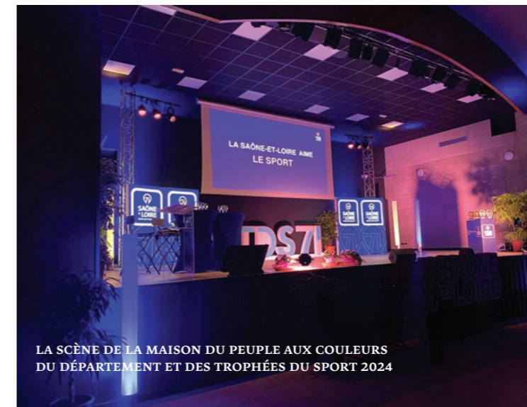
LA SCÈNE DE LA MAISON DU PEUPLE AUX COULEURS DU DÉPARTEMENT ET DES TROPHÉES DU SPORT 2024