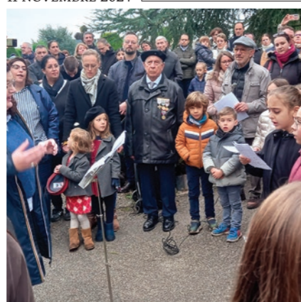
DES ENFANTS DE L'ÉCOLE ETIENNE-JULES MAREY ONT PRIS PART À LA COMMÉMORATION DU 11 NOVEMBRE 1918